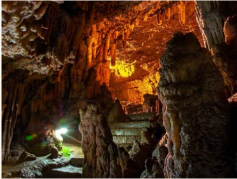
奇幻鐘乳石洞 Drogarati Cave