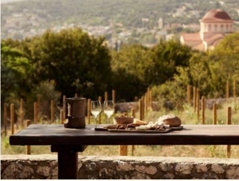
酒莊品酒巡禮 Wine taste Tour

這裡是許多旅人喜愛的度假秘境，彼此不相識的遊客們在此處短暫交會，延伸了日常生活的軸線，也豐富了彩虹島上色彩斑斕的一切美好。