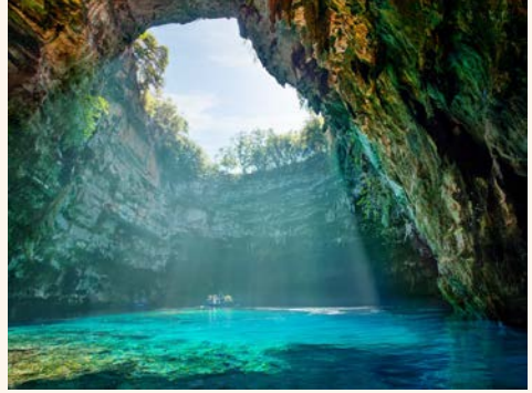
夢幻藍洞 Melissani Cave