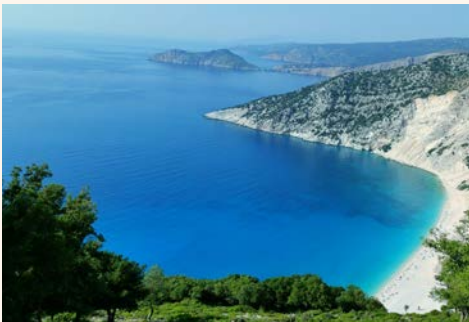
最美海灘 觀景平台 Myrto Beach Viewpoint