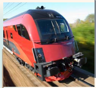
高速火車一等艙 ÖBB High Speed Train

◆貼心提醒：如遇高堡斜坡纜車維修或餐廳歲休，則以僧侶山登山電梯取代，眺望高堡及俯瞰老城美景，並於千年修道院享用午餐。