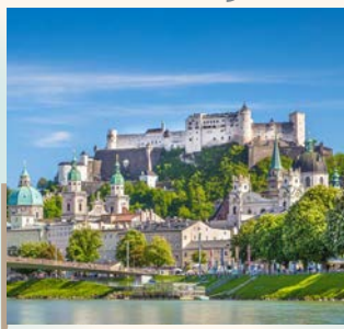
薩爾茲堡城堡 Festung Hohensalzburg

走訪▲米拉貝爾花園，電影【真善美】實際拍攝地，最令遊客印象深刻的是以希臘神話為主題的雕像、屹立中央的噴泉，映襯高堡景致，著實令人回憶湧現。