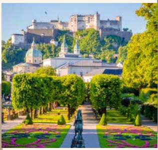
米拉貝爾花園 Mirabell Garden

掛滿獨特鍛鐵招牌的▲蓋特萊德街，有一棟醒目黃色建築為▲莫札特出生地，而由35座大鐘組合的▲市政廳鐘樓不時敲下悠揚樂聲與氣勢恢宏的▲薩爾茲堡大教堂相互輝映，更是旅人不容錯過的景點。