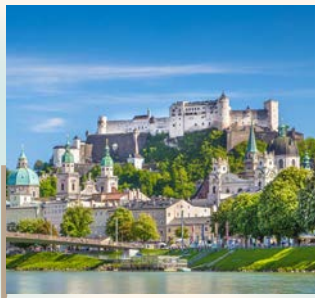
薩爾茲堡城堡 Festung Hohensalzburg

走訪▲米拉貝爾花園，電影【真善美】實際拍攝地，最令遊客印象深刻的是以希臘神話為主題的雕像、屹立中央的噴泉，映襯高堡景致，著實令人回憶湧現。